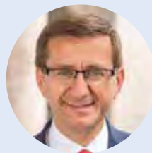
Markus Achleitner ZUSTÄNDIGE LANDESRAT

Wir sehen uns heute in Europa mit großen Herausforderungen konfrontiert, die für uns lange Zeit undenkbar waren: Eine weltweite Pandemie, Krieg in Europa und große, notwendige Transformationsprozesse – beispielsweise im Bereich der Energie. Um diese Herausforderungen zu lösen braucht es das gemeinsame Engagement. Nur ein geeintes Europa ist ein starkes Europa – und das beginnt in den Gemeinden und Regionen.